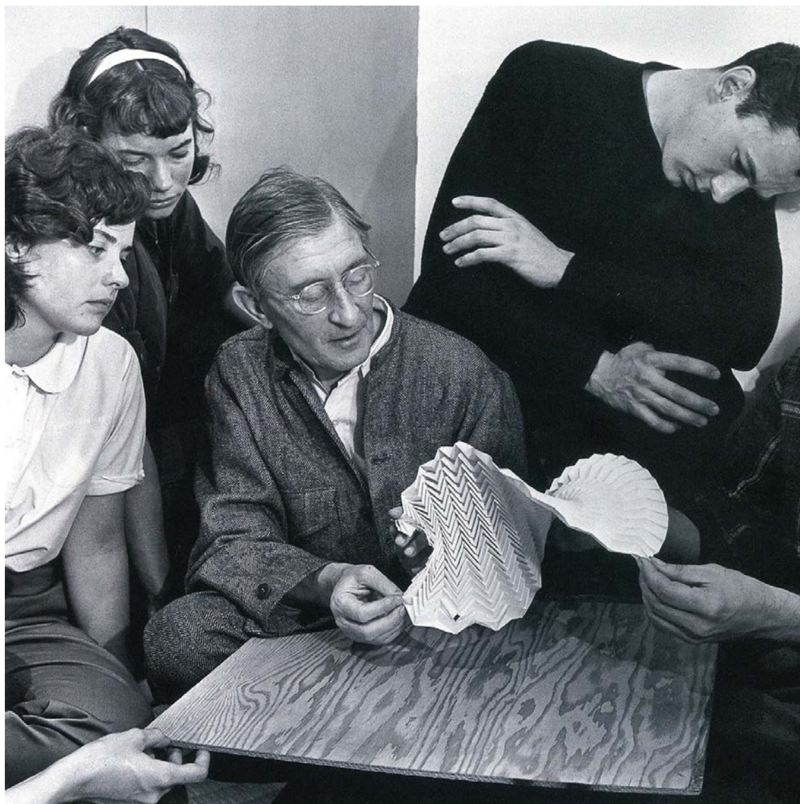
Josef Albers examining a folded paper construction with students at Black Mountain College, 1946, photo by Genevieve Naylor.